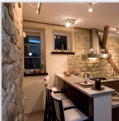
Stegu, Kamień elewacyjny Calabria 1. Zastosowanie: elewacje budynków, elementy dekoracyjne we wnętrzu, ogrodzenia i mała architektura.