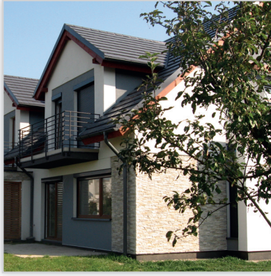
Stegu, Kamień elewacyjny Nepal 1. Zastosowanie: elewacje budynków, elementy dekoracyjne we wnętrzu, ogrodzenia i mała architektura.