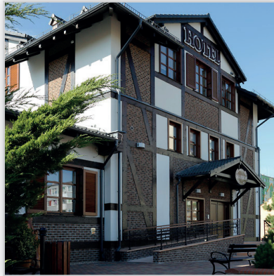
Stegu, Płytkę elewacyjną cegłopodobną Rustik 568. Zastosowanie: elewacje budynków, elementy dekoracyjne we wnętrzu, ogrodzenia i mała architektura.