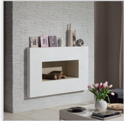
Stegu, Kamień elewacyjny Palermo 1. Zastosowanie: elewacje budynków, elementy dekoracyjne we wnętrzu, ogrodzenia i mała architektura.