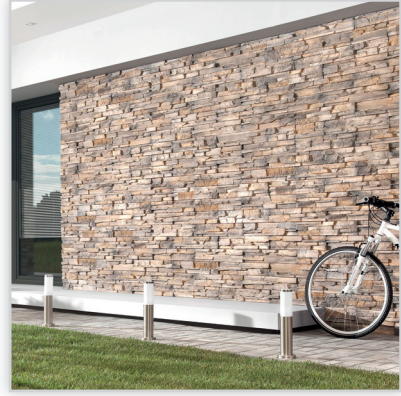
Stegu, Kamień elewacyjny Grenada 1. Zastosowanie: elewacje budynków, elementy dekoracyjne we wnętrzu, ogrodzenia i mała architektura.