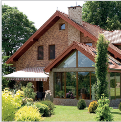
Stegu, Płytkę elewacyjną cegłopodobną Country 610. Zastosowanie: elewacje budynków, elementy dekoracyjne we wnętrzu, ogrodzenia i mała architektura.