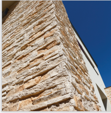
Stegu, Kamień elewacyjny Nepal 2. Zastosowanie: elewacje budynków, elementy dekoracyjne we wnętrzu, ogrodzenia i mała architektura.