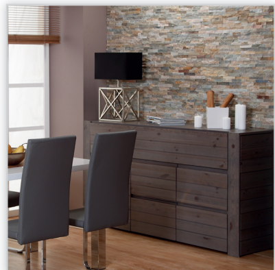
Stegu, Kamień naturalny ivory. Zastosowanie: elewacje budynków, elementy dekoracyjne we wnętrzu, ogrodzenia i mała architektura.